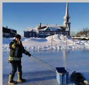
Primeur: Le tracteur à gazon sera bientôt modifié en mini-zamboni

Prochain défi: Un sentier de glace est présentement en train d'être aménagé. Profitez-en!