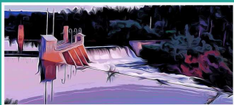
Le barrage Mitis-1 fête son 100e anniversaire en 2023